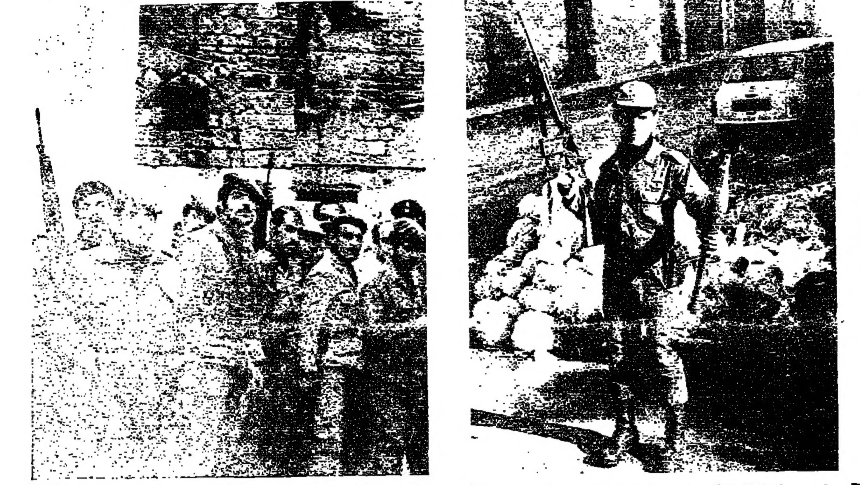
مجموعة من رجال الدرك داخل أحد الأحياء الضيقة في طرابلس